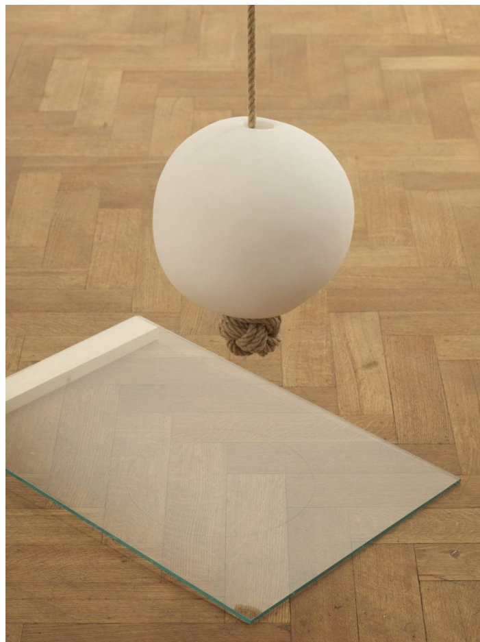
Kapwani Kiwanga, (gauche) Hydrosphères, 2015, disques vinyle, sel. Dimensions variables, pièce unique. (droite) Mami Wata, 2015, verre, bois, sel, corde. 300 x 61 x 40 cm.

J'ai observé d'un œil attentif l'écran où Kapwani Kiwanga me montrait les assemblages. Alors que ces œuvres étaient manifestement des sculptures, quelque chose dans la pièce Mami Wata évoquait selon moi un monument. Je me suis mise à imaginer sa plaque : Monument à la mémoire des enfants qui se trouvaient encore dans le ventre des femmes enceintes jetées hors des navires négriers dans l'Atlantique pendant le Passage du milieu . Elle n'était pas d'accord avec mon rapprochement hâtif entre l'œuvre et un monument. Elle ne souhaitait pas que la sculpture soit trop « figée ». Ses assemblages font partie d'une série de pièces qui abordent la mythologie et la religion vaudou , originaires du Bénin, en Afrique de l'Ouest. L'imaginaire et l'histoire de l'Atlantique noire ont une importance particulière pour l'artiste, tout comme le mythe de Drexciya apparu à la fin des années 1990, une ville sous-marine fondée par les enfants qui se trouvaient encore dans le ventre des femmes esclaves noyées, créé par le groupe techno de Détroit du même nom.