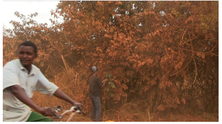
Kapwani Kiwanga, Vumbi, 2012, vidéo HD, couleur, son, 31 min.