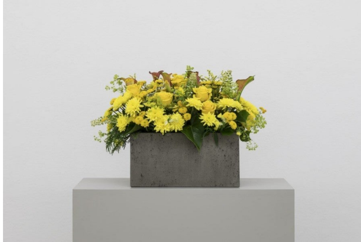
Kapwani Kiwanga, Flowers for Africa: Tanganyika , 2014, Protocole de création et de présentation à partir d'une photographie d'archive pour guider la reconstitution d'un arrangement floral composé de fleurs coupées. Dimensions variables. Collection FRAC PACA, Marseille. Vue de l'exposition : Flowers are Documents, Arrangement I. © ar/ge kunst, photo : Tiberio Sorvillo, 2017

Tanzanie actuelle dont l'indépendance fut célébrée en 1964. Dans chacun de ces protocoles, l'artiste explique aux lieux d'exposition intéressés comment, avec l'aide de fleuristes locaux, arranger les bouquets à partir d'une composition florale réalisée à l'occasion de l'indépendance d'une nation africaine. À la fois éphémère et écologique, le projet prévoit que les fleurs ne seront pas renouvelées après être fanées. Dans cette exposition, les fleurs ont le droit de sécher et de pourrir. La vie post-mortem de ces œuvres est destinée au compost.