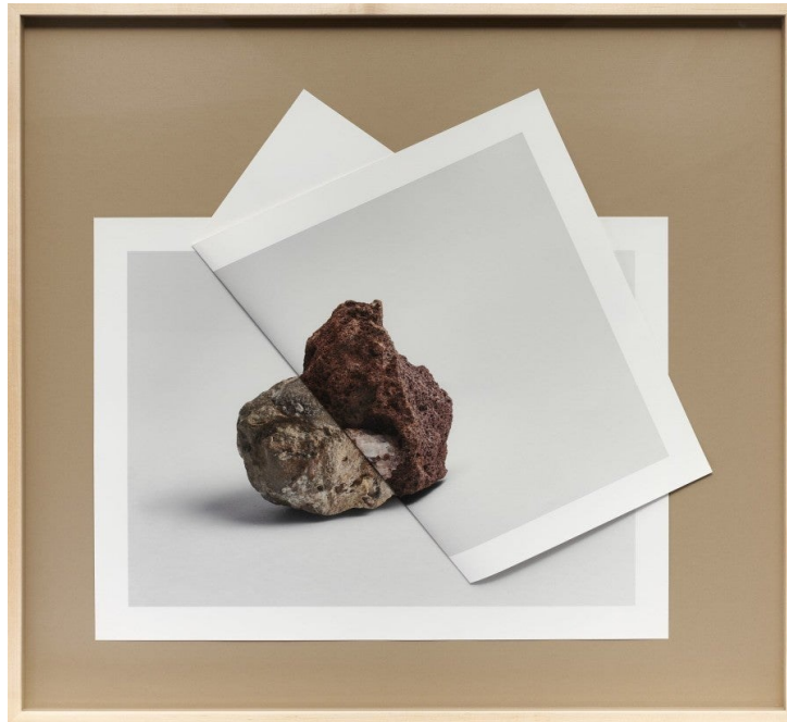
Kapwani Kiwanga, Subduction Study #8 , 2017. Impressions pigmentaires pliées, fond cartonné, cadre en chêne, verre. 83,5 x 92 x 3 cm. Courtesy de l’artiste et de la galerie Jérôme Poggi, Paris / galerie Tanja Wagner, Berlin / Goodman gallery, Johannesburg - Cape Town

particulièrement efficace dans ce drapeau – comme dans d’autres drapeaux et d’autres œuvres pour lesquelles l’artiste a reçu divers prix – se trouve dans l’usage soigneusement étudié de l’abstraction (géométrique). Une minutie qui se manifeste dans les plus petits détails : la manière dont l’inclinaison de la crose du mousquet est saisie par l’oblique bordée de bleu ; la façon dont un panneau rouge est précisément drapé afin de compléter la forme grise en sequins dessinant ainsi un triangle parfait.