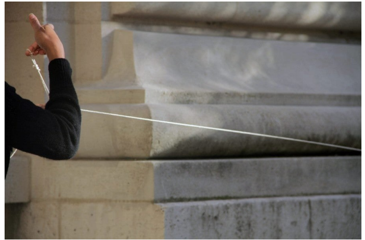
Kapwani Kiwanga, Binding Ties : Grand Palais, 2014. Performance. Bois, ficelle.

Beaucoup de personnes se débattent avec la suspension consentie d'incrédulité. La crédulité est un mécanisme qui se produit selon un ensemble de variations. La capacité à faire des associations ou simplement à produire des idées se situe à l'extrémité inférieure de l'échelle de mesure de la crédulité. Elle est suivie par divers exercices tels que le voyage dans le temps, précédé de son rembobinage, puis l'on trouve des choses plus complexes comme la capacité à être témoin du rapatriement d'un artiste dans l'espace, ou celle de pouvoir écouter attentivement et comprendre une conférence donnée par une anthropologue galactique venue d'une autre époque. La plupart des gens sont incroyables face à l'hypothèse de la création d'une station spatiale développée par les États unis d'Afrique, alors que les États-Unis en seront eux-mêmes dépourvus. Des révolutions surviennent et les gens y prennent part. Par la suite, ces mêmes personnes s'interrogent sur ce qui s'est réellement passé, et même si elles y étaient bien présentes.