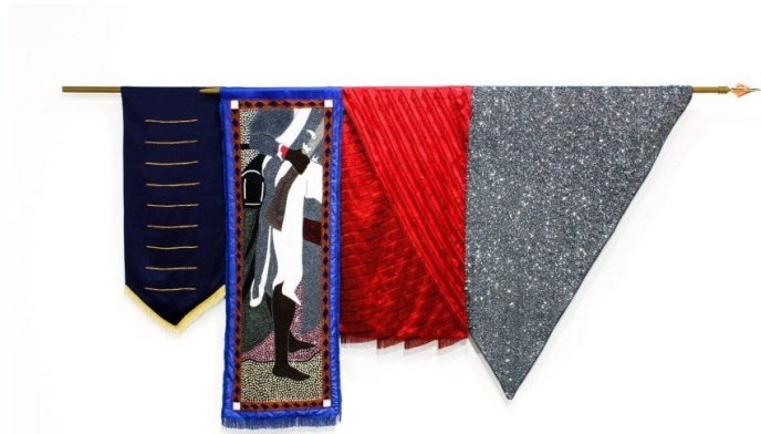
Kapwani Kiwanga, Nations : Vertières, 1803 , 2018. Tissu brodé, tissu, tissu de perles, sequin, barre d'acier. 158 x 330 x 10 cm. Collection privée. Courtesy de l'artiste et de la Galerie Jérôme Poggi, Paris

fermeture. Elle était en train de finir Nations (2018), un projet qui rassemble trois installations constituées de drapeaux confectionnés avec différents types de tissu, des sequins et des petites perles. L'idée du projet a germé alors qu'elle séjournait à Haïti en 2009 où elle a pris part aux cérémonies syncrétiques du vaudou haïtien. Les drapó vodou sont de sublimes drapeaux brodés de perles et de sequins, souvent utilisés lors des cérémonies, ce sont des objets recherchés par les collectionneurs et les touristes depuis les années 1950. Dans le monde de l'art, ils sont surtout connus par le travail d'Antoine Oleyant (1955-1992). Au début du mois de décembre 2018, je me suis rendue à Miami pour voir les trois œuvres exposées par la galerie parisienne de l'artiste, Jérôme Poggi, à l'occasion de la foire Art Basel Miami.