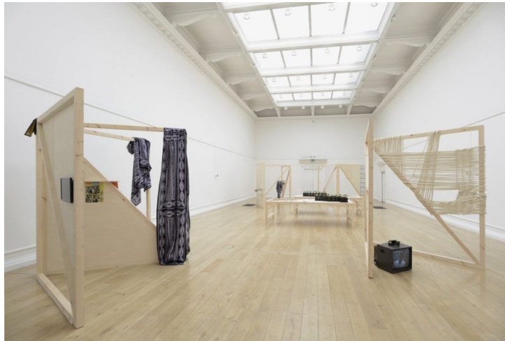
Kapwani Kiwanga, Kinjeketile Suite , 2015. Installation mixte, audio, performance. Dimensions variables. Vue de l'exposition à la South London Gallery, 2015.

Afin de tester la crédulité, Kapwani Kiwanga se tourne vers l'histoire ; elle part étudier des archives en Afrique et en Europe, et se rend en Tanzanie pour y effectuer des recherches sur la guerre Maji-Maji. Consciente que tout soulèvement politique est motivé par la croyance, elle se penche sur l'histoire de cette rébellion entre 1905 et 1907 afin de comprendre les mécanismes de la crédulité qui ont conduit au soulèvement des Africains de l'Est au Tanganyika contre le régime colonial allemand. La rébellion est entourée d'un mythe selon lequel le médium Kinjeketile Ngwale aurait aspergé les combattants de maji ya uzima , une eau de la vie sacrée, avant qu'ils ne partent au combat, les enveloppant ainsi d'une aura d'invincibilité. La rébellion a été vaincue, mais le nationalisme est né. Les recherches de Kiwanga lui ont permis de réaliser plusieurs œuvres entre 2014 et 2016. Maji Maji: fragments of a screenplay (2014) est une performance multimodale, tandis que Kinjeketile Suite (2015) est une installation qui a été réalisée à partir de quatre structures de support en bois conçues pour accueillir des documents, des objets, des témoignages, une performance et, plus tard, une vidéo où apparaît une interprétation en anglais et en swahili d'une pièce de théâtre écrite en 1969 par le dramaturge tanzanien Ebrahim Hussein.