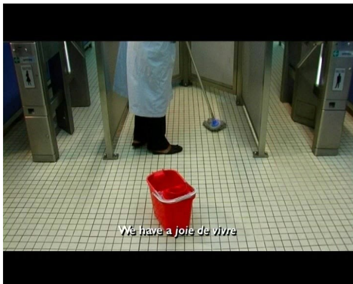
Kapwani Kiwanga, Bon Voyage, 2006, vidéo, couleur, son, 3 min

Elle s'installe ensuite à Paris, quittant le monde du film documentaire pour celui de l'art contemporain. Elle débute un cursus à l'École nationale supérieure des beaux-arts puis au Fresnoy, un programme national de studio à Tourcoing, dans le nord de la France. Lorsque nous nous sommes rencontrées en novembre 2018, je l'ai interrogée sur cette transition. Elle m'a répondu qu'avec le recul elle comprenait qu'elle s'efforçait à l'époque de sortir des limites d'un seul médium ou domaine. Les disciplines lui semblaient contraignantes. Elle s'intéressait aux « différentes intelligences » que l'art peut offrir et à la possibilité d'élargir sa pratique à d'autres modalités sensorielles.