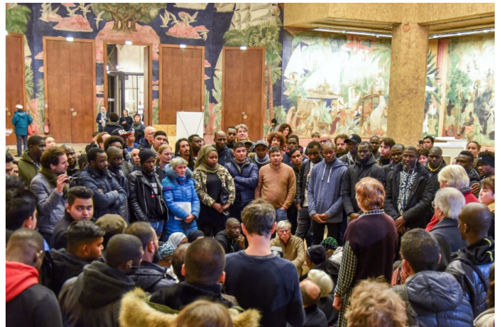
Assemblée publique de l'École des actes au Musée national de l'histoire de l'immigration à Paris, le 14 février 2020, sur une invitation de l'association Civic City.

Il s'agit aussi d'un espace de collaborations artistiques avec les usager-ères et certains membres de l'équipe de l'École des Actes. L'artiste Gaëlle Choïse a commencé à travailler avec la structure en 2016 autour d'un projet de film qui s'intitule lui aussi L'École des Actes . Cette œuvre a été initiée dans le cadre de l'action Nouveaux Commanditaires et produite par l'association Societies. Il s'agissait de parler de l'École des Actes, des conditions politiques de certaines personnes migrantes en France, de solidarité et de réparation, mais aussi de cinéma, documentaire tout particulièrement. À l'occasion de séances de travail, les volontaires ont choisi le personnage qu'ils souhaitaient incarner. Pour Gaëlle