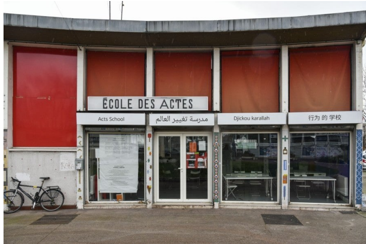
Vue de l'École des actes à Aubervilliers.

traitée une question choisie. Elles se basent sur une méthode de travail spécifique : ce qui est dit lors de ces assemblées est systématiquement traduit, tour à tour, dans l'ensemble des langues des participant-es du jour de manière à ce que chacun-e puisse suivre le déroulement de la discussion et y participer. L'École des Actes défend ainsi l'idée d'une pensée patiente, mais aussi d'une connaissance directe des situations de notre monde constituée à partir de l'expérience des participant-es présent-es. La régularité des assemblées permet la continuité d'un travail collectif et fait place à la durée nécessaire, parfois de plusieurs mois, pour qu'émerge une proposition nouvelle. Le projet garde cette idée d'un lieu qui se construit avec ses usager-ères.