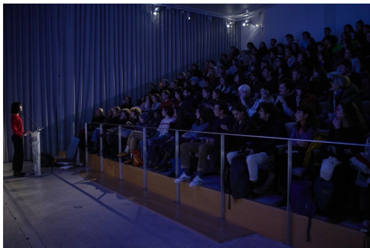
Angels' Front, image extraite de la série de performances Cannibales, 2023-2024.