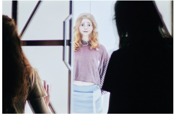
Angels' Front, images extraites de la série de performances Cannibales, 2023-2024.