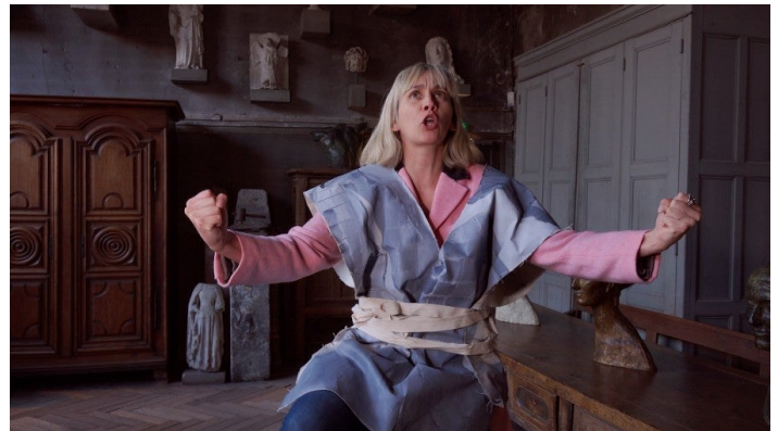
Liv Schulman, The Gouvernement , série vidéo en 6 épisodes, HD, durée des épisodes: 07:26, 30:50, 16:34, 08:27, 21:32, 09:04 minutes, 2019.

Les documents historiques se mêlent à la fiction, les chroniques des différentes époques se mélangent aux références contemporaines.