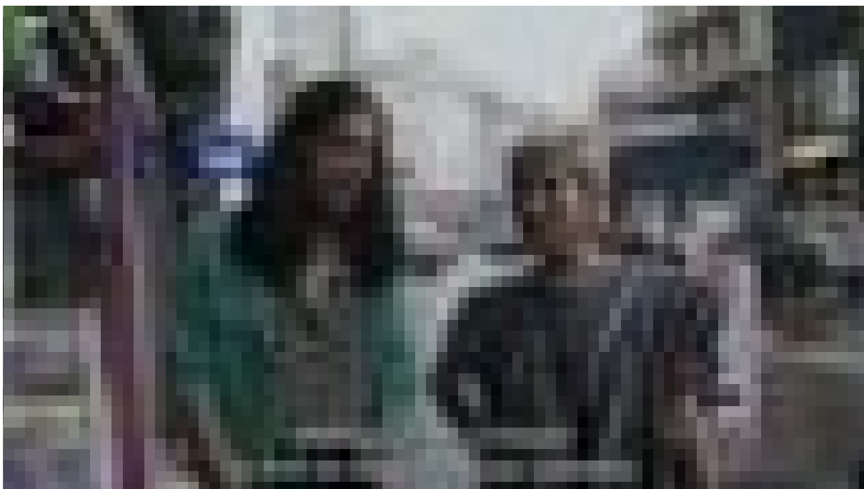
Liv Schulman, A Circle That Rolled Away , vidéo 6K, 35' min, 2024.

Je rencontre Liv Schulman dans le Microcentro, le quartier d'affaires de Buenos Aires. Les rues sont remplies des conversations des gens qui passent, et une série de voix semble créer une pulsation qui marque le rythme de tout : change, change, change. C'est le son des vendeurs de dollars illégaux. La raison de notre rencontre ici est que nous prévoyons de suivre le parcours urbain que l'on peut voir dans sa dernière vidéo, A Circle That Rolled Away (2024). Le projet a commencé par une observation : la population de cette ville s'exprime tout le temps dans la rue. Ces personnes mettent en mots ce qui leur arrive. Elles parlent de leurs états émotionnels, mais elles cherchent aussi à faire entrer l'autre dans un état d'esprit particulier. Elles donnent et cherchent quelque chose en retour. Cette réflexion de Liv Schulman est possible grâce à la distance, cet espace qui s'est ouvert depuis qu'elle vit à Paris. Les personnages de son film sont nombreux et se mêlent aux gens ordinaires qui marchent dans la rue. Ils sont si nombreux qu'il est parfois difficile de savoir qui appartient à cet univers fictif et qui n'en fait pas partie. Ensemble, ils forment une sorte de chorégraphie et de bande sonore d'un dialogue continu qui donne forme à une pensée exprimée à haute voix, qui semble appartenir à la ville elle-même.