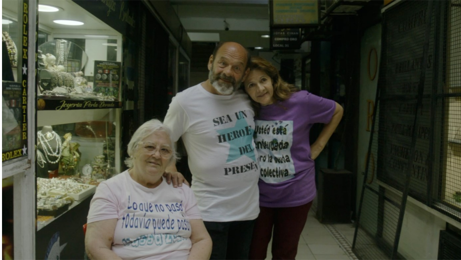
Liv Schulman, A Circle That Rolled Away , vidéo, 35' min, 2024.