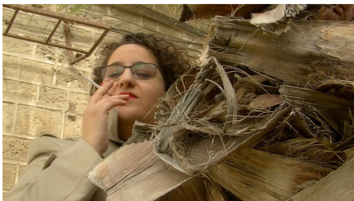
Liv Schulman, Control a TV Show , série télévisée en trois saisons, 21 épisodes, vidéo HD, 2010-17.