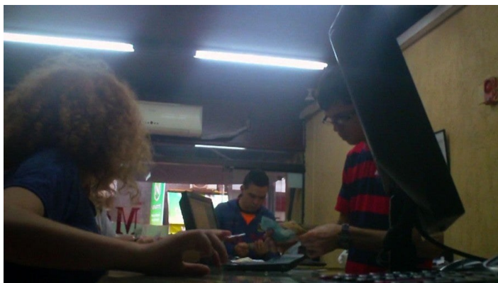
Liv Schulman, The Disappearance , vidéo, 50' min, 2013.