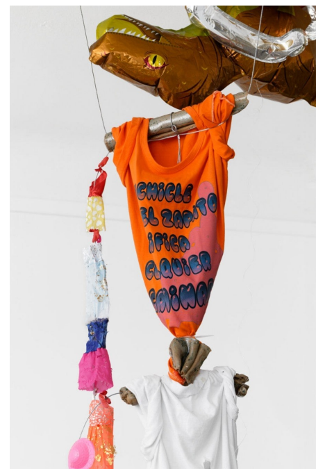
Vues de l'exposition Un círculo que se fue rodando de Liv Schulman, galerie Anne Barrault, 2024.

Pendant que nous parlions, en regardant l'horizon brun du fleuve, l'image d'un corps étrange et démesuré se profilant sur le paysage m'est revenue à l'esprit. Sa silhouette m'est apparue, se nourrissant de ses propres excréments, comme repliée sur le chemin de sa bouche à son anus. En se nourrissant de ses déchets, il grandit de plus en plus, jusqu'à tout envahir. Ce corps n'a plus besoin de marcher ni de saisir des objets avec les mains. Il perd peu à peu sa forme, son seul mouvement est la croissance. Dans son développement, il fracture les divisions qui organisent notre vie : sommeil et veille, travail et loisir, nourriture et déchets, viscères et peau. Son sexe n'est qu'une surface ; qu'il soit concave ou convexe n'importe plus, il est conçu pour être en contact.